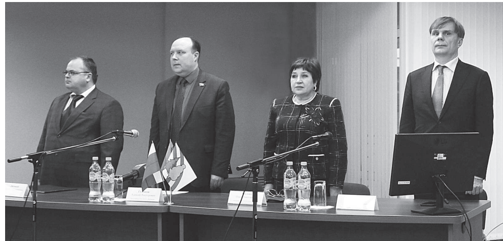
Глава города ЗАТО г. Радужный С.В. Лисецкий, председатель СНД ЗАТО г. Радужный А.В. Гусенков, председатель Законодательного собрания Владимирской области О.Н. Хохлова и министр финансов Владимирской области М.С. Васенин.

- Радужный - один из самых юных и активных городов, где процесс модернизации