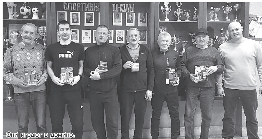
Они играют в домино.