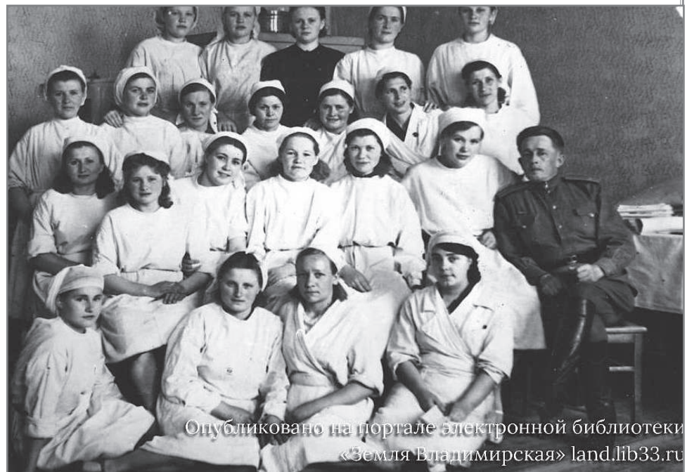
Опубликовано на портале электронной библиотеки «Земля Владимирская» land.lib33.ru

Самые тяжёлые дни госпиталь переживал, когда шли бои под Москвой. Осенью 1941-го раненых было так много, что среди врачей случались голодные обмороки. Нет, кормить медперсонал (как и тех, кто находился на лечении) старались хорошо. Просто врачи не могли прервать работу, чтобы поесть. Операции шли практически круглые сутки. Для спасения жизни солдат порой важна была каждая минута. К сожалению, спасти удалось не всех. Сегодня уже точно известно, что с июня 1941-го по декабрь 1943-го только в госпитале №1390 от ран скончались 617 солдат и офицеров. Фамилии всех их сегодня известны благодаря кропотливой работе поисковиков.