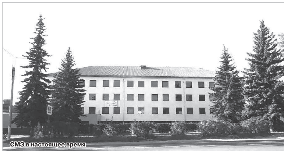
СМЗ в настоящее время