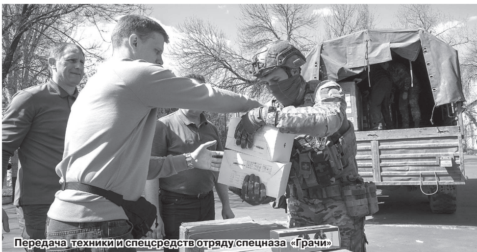
Передача техники и спецсредств отряду спецназа «Грачи»

И наша общая задача сделать так, чтобы деды, прадеды, которые нам добыли ту победу, были горды за то, что мы выстояли на этом новом для нас жизненном этапе и защитили российскую историю, защитили свой народ. Спасибо нашим ветеранам Великой Отечественной войны. Спасибо ветеранам специальной военной операции. Они выполняют огромную историческую миссию. Наша задача победить и в этой победе закрепить нашу русскую историю.