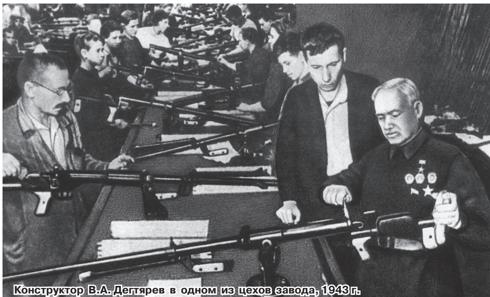
Конструктор В.А. Дегтярев в одном из цехов завода, 1943 г.