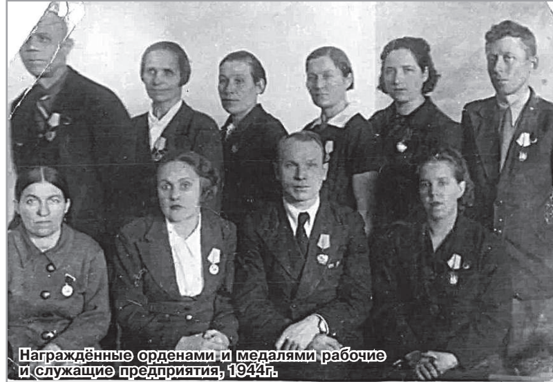
Награждённые орденами и медалями рабочие и служащие предприятия, 1944г.

Самоотверженный труд и доблесть в тяжёлое военное лихолетье - то, что отличало трудовой коллектив прядильно-ткацкой фабрики имени Лакина в небольшом рабочем посёлке Лакинский Собинского района. Казалось бы, что мог сделать маленький текстильный посёлок в масштабах огромной страны? Но именно из тысячи таких посёлков, сёл и деревень, малых и больших городов начинали произрастать корни будущей победы.