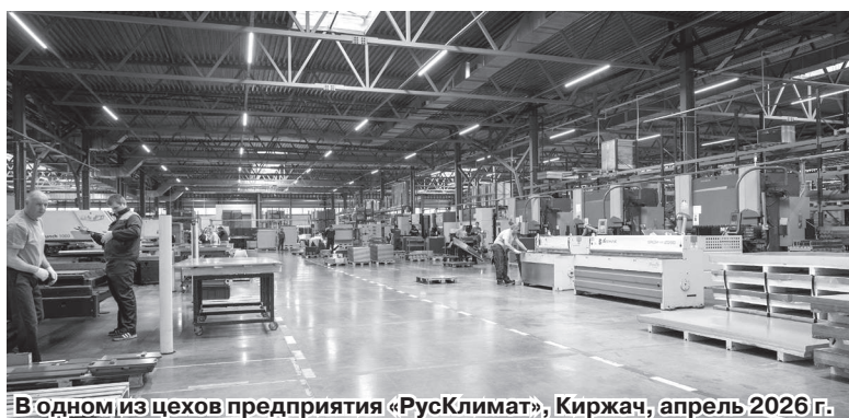
В одном из цехов предприятия «РусКлимат», Киржач, апрель 2026 г.

Для вступления в ряды мобилизационного резерва «БАРС-Владимир» обращайтесь в военный комиссариат по месту жительства или регистрации.