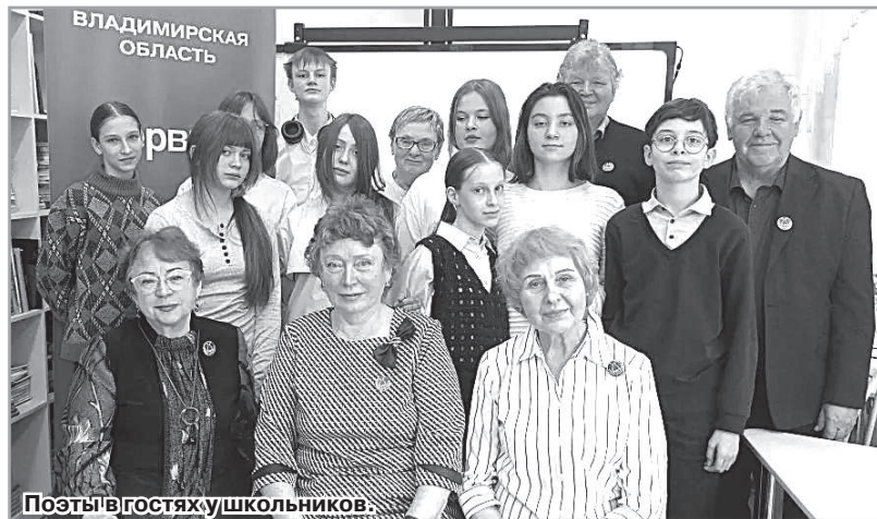
Поэты в гостях у школьников.

В самом начале весны, 5 марта, когда всё вокруг пребывает «на старте всеобновляющего прорыва», стартовали «Школьные поэтические встречи».